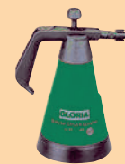
GLORIA special sprayer 89 fine sprayer 05