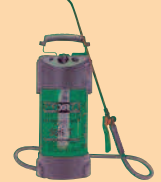
GLORIA 505 T GLORIA 510 TK GLORIA PRO8 GLORIA PRO5