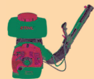
Atomizzatore a spalla STIHL SR 450